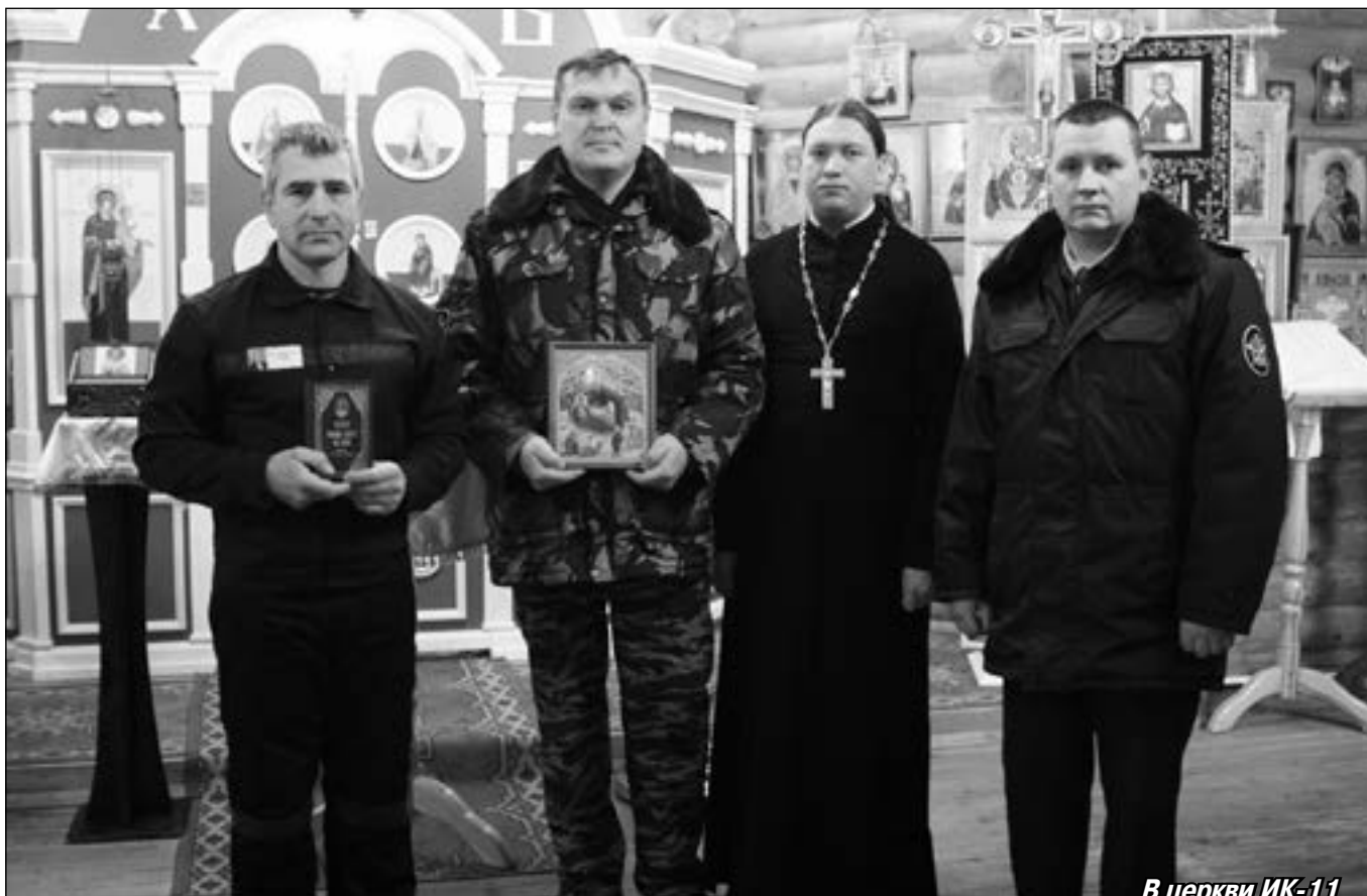
В церкви ИК-11