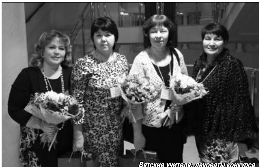
Вятские учителя-лауреаты конкурса

Самое главное — есть чему поучиться: здесь государственные структуры уже два десятилетия весьма успешно сотрудничают с различными религиозными конфессиями. Причём сегодня республика Мордовия — абсолютный лидер страны по количеству православных приходов на душу населения. «Здесь живёт действительно верующий, православный народ», — отметил Патриарх Кирилл