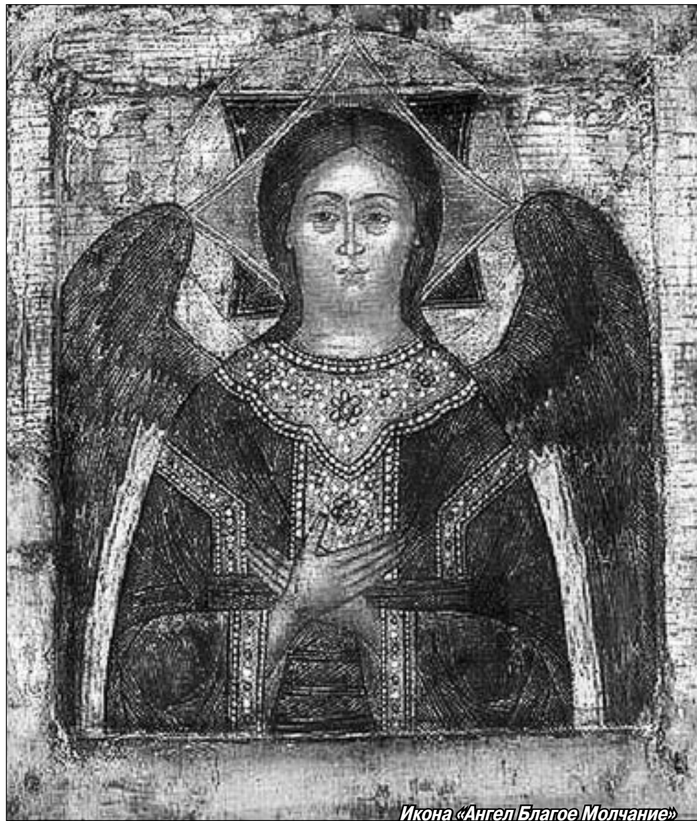
Икона «Ангел Благое Молчание»

Надо ли говорить, что ни в тот приезд, ни в последующие в Троице-Сергиевой Лавре иконы «Ангел Благое Молчание» я так и не увидел, да и в других местах не встречал. Но вдруг через двадцать лет, когда та лаврская благодатная тишина стала истончаться, как путеводная нить, когда само название иконы стало забываться в разговорах, которыми тщетно надеялся заболтать набегающую печаль и обостряющуюся боль, не замечая, как мало они помогают, разговоры эти, вдруг приходит по электронке это доброе письмо с вложением «Ангел Благое Молчание». Открыл я файл и засмотрелся на поясное изображение Ангела, спокойно-благообразные черты лика которого проступали на золотом фоне иконы. Лёгкие крылья, раскрытые за спиной, тонкие руки, скрещенные на груди поверх багряных одежд с золотыми оплечьями, исполненный спокойной и