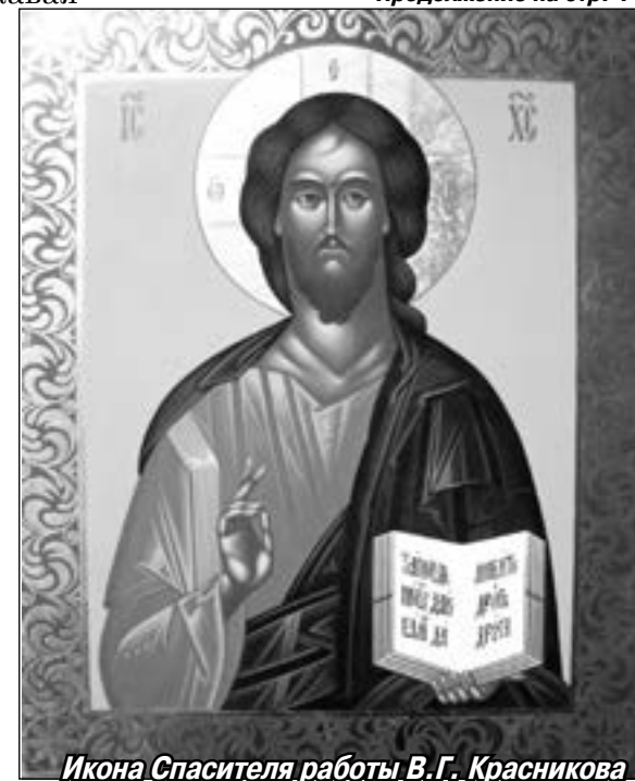
Икона Спасителя работы В.Г. Красникова