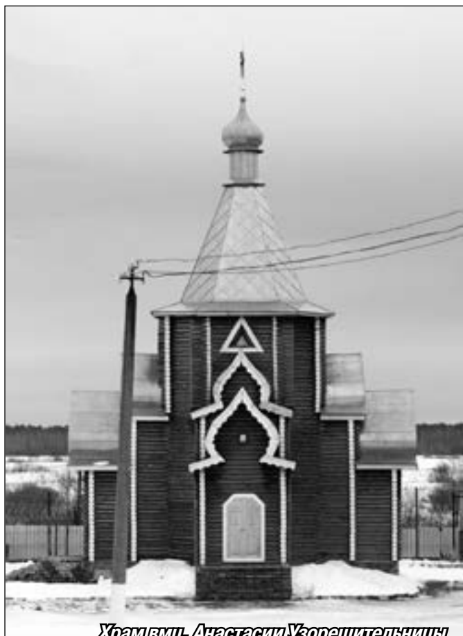
Храм в честь Анастасии Узорешительницы

кресную школу, сказал: «Если ходишь, ходи постоянно, чтобы не было повода для смеха». Такая мотивация помогла в сложные моменты, когда хотелось всё бросить».