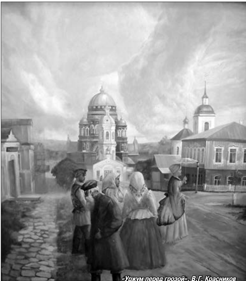
«Уржум перед грозой». В.Г. Красников