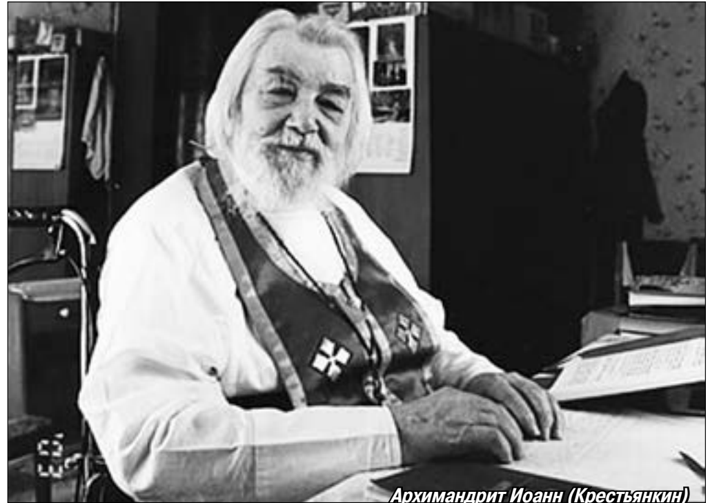
Архимандрит Иоанн (Крестьянкин)

О духовной жизни старец говорил: «Как только достигнем меры «жажды прискорбности», так и поймём, что начинается истинная духовная жизнь, а не игра в неё или, вернее, недалёкие к ней подступы». В 1950 году отец Иоанн был арестован. Донос на него написали его настоятель, регент и протодиакон храма, где он служил. На допросах отец Иоанн не назвал ни одного имени, понимая, что все названные им люди будут арестованы. Батюшка претерпел два месяца Лубянки, два месяца одиночки Лефортовской тюрьмы,