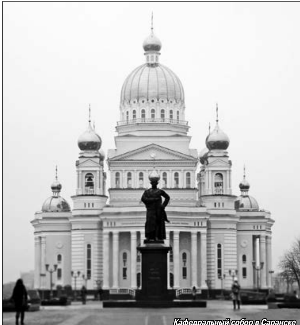
Кафедральный собор в Саранске

его находится напротив красивейшего кафедрального собора. Этот великолепный бело-голубой храм как будто парит над Саранском. Освящён он в честь праведного Феодора Ушакова. Белый мрамор для его строительства «родом» из Китая. На 30-метровой высоте рядом с куполами храма находится смотровая площадка, с которой виден весь город.