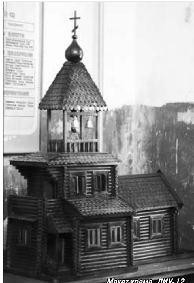
Макет храма. ЛИУ-12