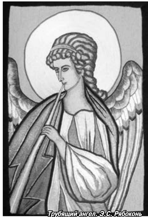
Трубящий ангел. Э.С. Рябокони